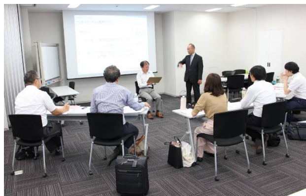
プレゼンテーション演習