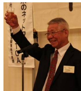
大輪理事長の乾杯ご発声