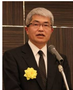
高崎関東総合通信局長のご挨拶

最後になりますが、情報通信設備協会及び会員各社の益々のご発展とご参集の皆様のご健康とご多幸を祈念いたしまして、簡単ではございますが、新年にあたりましてのご挨拶とさせていただきます。ありがとうございました。