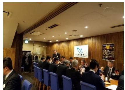
和やかな歓談様子