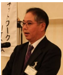
松山副本部長の中締め