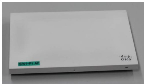
Wi-Fiアクセスポイント装置