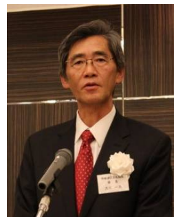
大木会長のご挨拶

本部といたしましてはこれまで以上に地方本部の皆様と力を合わせ、そして知恵を結集いたしまして、今日お集まりの皆さんと共に、本年がより良い年となりますよう努めて参りたいと思っておりますので、どうか引き続きご協力ご支援の程、宜しくお願い申し上げます。簡単ではございますけれども、新年のご挨拶とさせていただきます。